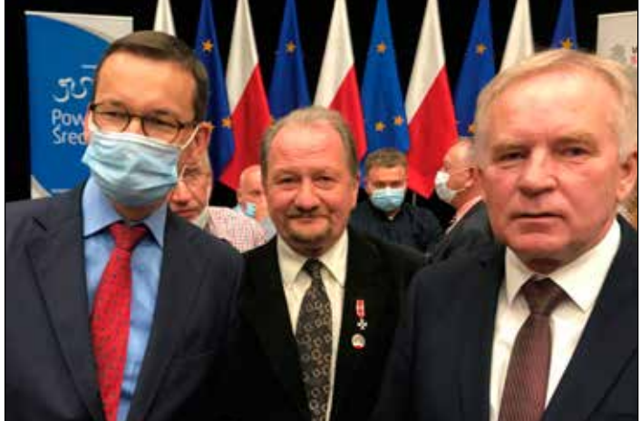
Premier Mazowiecki prezentował FIL w Środziew Wlkp

Bardzo dobry odbiór tego programu sprawił, że rząd postanowił podwoić wysokość pomocy dla samorządów o kolejne 6 mld zł. Ta pula środków będzie jednak przyznawana w ramach wyznaczonych kryteriów, a więc środki trafią do najlepiej ocenionych projektów.