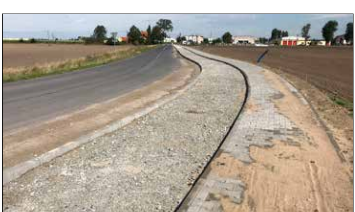
Budowa ścieżki rowerowej przy ul. Sportowej

Rozstrzygnięty został przetarg na budowę ścieżki pieszo-rowerowej z Kleszczewą do Nagrodowic. Brak tego typu infrastruktury – rocherowej z bezpiecznego pobocza, nie mówiąc już o zagrożeniach na skrzyżowaniu w rejonie Nagrodowic były przyczyną kilku wypadków śmiertelnych przy drodze wojewódzkiej nr 434. W ramach inwestycji powstaną 1330m ciągu pieszo-rowerowej, a także parking dla rowerów w rejonie przychodni lekarskiej w Nagrodowicach. Nowoczesne miejsca zyskają oświetlenie, a na przejściu dla pieszych w rejonie skrzyżowania drogi 434 z drogą Nagrodowic-Buk jest postawiona sygnalizacja świetlna wzbudzająca przez pieszych w rowerzystów. Dodajmy, że w trakcie przebudowy jest ulica Sportowa w Kleszczewie. W ramach tej inwestycji powstaje także ścieżka rowerowa o długości ponad 800m. Powstająca trasa dla rowerzystów będzie więc miała łącznie ponad 2 km. Obie inwestycje powstają dzięki dotacji z Wielkopolskiego Regionalnego Programu Operacyjnego 2014–2020.