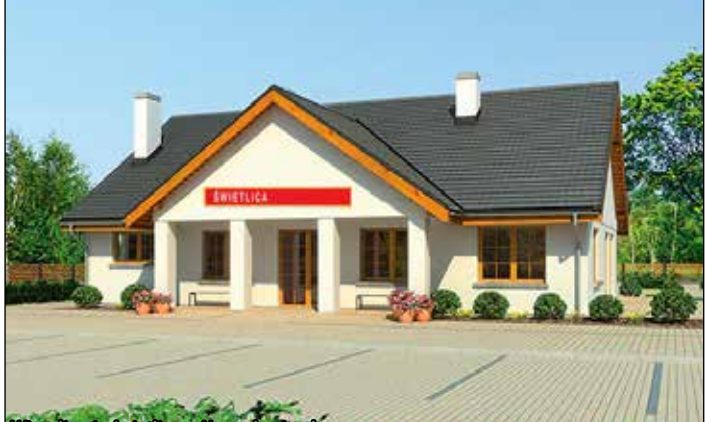
Wizualizacja świetlicy w Nagrodowicach

Rewitalizacja przestrzeni, to główny cel wsparcia unijnego, które ma podnieść atrakcyjność oznawianego obszaru, i stąd też ostatnie z pakietu działań również dotyczy odnowy obiektu, a konkretnie stawu wiejskiego. Staw w Komornikach zostanie oczyszczony i wzbogacony w ciekawy element architektoniczny, a na brzegu pojawią się elementy placu zabaw. W przypadku Komornik jest już gotowe pozwolenie na przebudowę strażnicy ze świetlicą, natomiast park i staw będą rewitalizowane w trybie zaprojektuj i wybuduj. Na etapie składania wniosku przygotowana była koncepcja urbanistyczna prac. Niestety system zaprojektuj i wybuduj nie uwzględnia możliwości wcześniejszego skompletowania dokumentacji, stąd pomimo upływu czasu nie było możliwe przygotowanie projektów technicznych, a więc upłyne jeszcze sporo czasu na przygotowania do rozpoczęcia zadania.