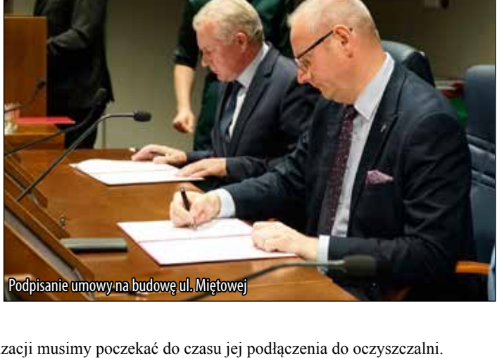
Podpisanie umowy na budowę ul. Miętowej

Dodatkowe środki z budżetu Państwa, w ramach kolejnego rządowego programu: Funduszu Inwestycji Lokalnych, dają szansę na pozytywną odpowiedź na zgłaszany od lat przez Gminę wniosek w sprawie budowy ulicy Stokiereckiej w Gowarzewie. Zostały już podjęte rozmowy z Powiatem Poznańskim dotyczące blisko kilometrowego odcinka tej drogi. Zabiegając o wybudowanie przez Powiat ze środków z FIS tej ważnej komunikacyjnej ulicy Gmina przygotowała, podobnie jak w przypadku ulic osiedlowych, a wcześniej, jak w przypadku ul. Swarzędzkiej, projekt kanalizacji sanitarnej. Tak duży zakres budowy sieci kanalizacyjnych bez wsparcia zewnętrznego to obciążenie dla budżetu Gminy, zgłaszając że w trakcie budowy jest oczyszczalnia ścieków, a także odcinki kanalizacji i wodociągów powstające z udziałem środków WRPO oraz ogromny projekt komunikacyjny.