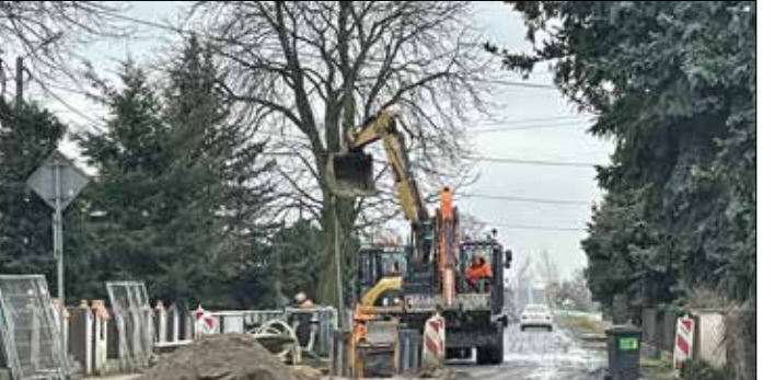
Budowa kanalizacji Komorniki – Hoppecke

Największy pod względem długości zakres robót kanalizacyjnych jest wykonywany na odcinku od Nagradowic do przepompowni ścieków zlokalizowanej w pobliżu strażnicy OSP w Kleszczewie. Niestety prace mają znaczne opóźnienie w stosunku do planu, jednak w najbliższych dniach wykonawca zapowiada duże przyspieszenie tempa.