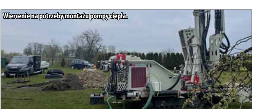
Wiercenie na potrzeby montażu pomp ciepła.

Dobiegła końca realizacja drugiego z trzech komponentów programu rozwoju Odnawialnych Źródeł Energii na terenie gmin Kleszczewo i Krzykosy. Po kolektorach słonecznych, nadszedł czas na finał montażu paneli fotowoltaicznych – obecnie dobiegają końca formalności odbiorowe. Na terenie obu gmin oddano do użytku 329 instalacji, z tego 136 na terenie gminy Kleszczewo. Trzeci komponent tego programu to budowa pomp ciepła, których zostanie zamontowanych 50 – po 25 w każdej z gmin. Koszty inwestycji z założenia pokrywa w 85% UE, w pozostałym zakresie przysiężli użytkownicy tych instalacji.