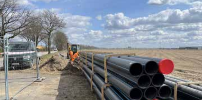
Budowa kanalizacji – Nagradowice-Komorniki