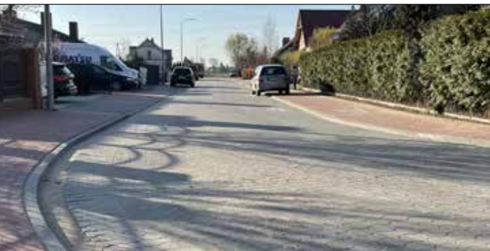
Ul. Lawendowa w Gowarzewie

Dobiegła końca robota budowlanej przy budowie ulic Szalwiowej i części Lawendowej w Gowarzewie. Efektem jest 400m ulicy z dwustronnym chodnikiem. Inwestycja objęła również budowę 215m kanalizacji deszczowej, 243m kanalizacji sanitarnej oraz 18 przyłączy kanalizacyjnych o łącznej długości 89m. Koszt budowy ulicy wraz z kanalizacją wynosi 1.585.918,80 zł. Ze środków Rządowego Funduszu Rozwoju Dróg otrzymamy dofinansowanie w wysokości 542.868,77zł.