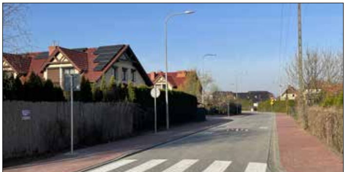
Ulica Miętowa w Gowarzewie