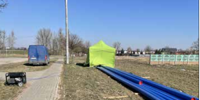
Budowa sieci wodociągowej – Komorniki

W Komornikach nie dość, że na trzech frontach prowadzone są roboty kanalizacyjne, to jeszcze czwarty wykonawca buduje duży zakres sieci wodociągowej mającej za zadanie doprowadzenie w niedalekiej przyszłości do połączenia wybudowanych wcześniej odcinków sieci przesyłowej od SUW w Nagradowicach – kontynuacja od skrzyżowania na Bylin do wiaduktu nad autostradą A2. W części jest to budowa rurociągu przesyłowego, w części przebudowa zwiększająca możliwości przesyłu wody w dotychczasowej sieci, a w części – tej, która jest realizowana na terenie centrum wsi w kierunku stawu, jest to modernizacja sieci rozdzielczej. Łącznie na terenie Komornik zostanie wybudowanych 1459 m wodociągów. W ramach tej samej inwe-