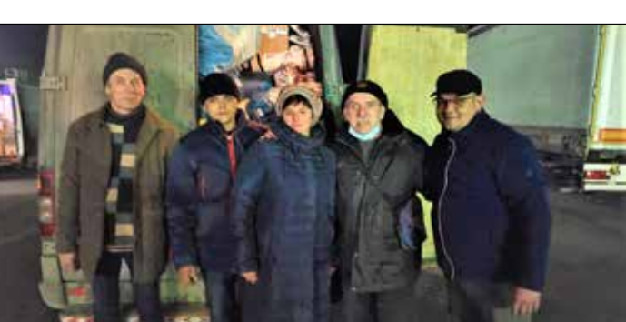
Transport darów – granica