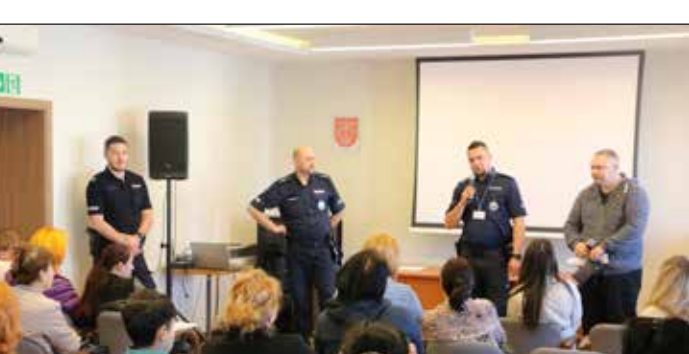
Spotkanie informacyjne – bezpieczeństwo