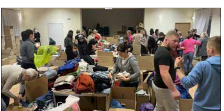
AMELOVE – segregacja darów