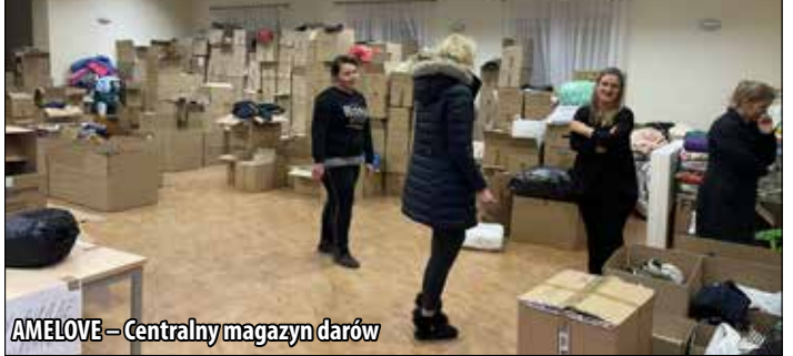
AMELOVE – centralny magazyn darów