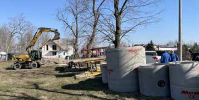
Budowa kolektora kanalizacyjnego – Komorniki

Od Nagradowic, aż po centrum Komornik realizowane są prace związane z rozwojem sieci kanalizacyjnych. Roboty prowadzi aż trzech wykonawców – dwóch z ramienia Gminy, trzeci na zlecenie firmy Hoppecke Baterie Polska. Firma Hoppecke realizuje odcinek kanalizacji, który będzie służył zarówno potrzebom firmy, jak również innym przyszłym użytkownikom. Co ważne, po zakończeniu inwestycja zostanie nieodpłatnie przekazana Zakładowi Komunalnemu. Koszt wykonania przyłączy umożliwiających przyłączenie się mieszkańcom pokryje Gmina. Po wykonaniu kanalizacji pozostałe zmodernizowany fragment ulicy – koszty ulepszeń polegających na poszerzeniu jezdni i chodnika oraz wykonania wpuśców ulicznych także zostaną pokryte z budżetu gminy.