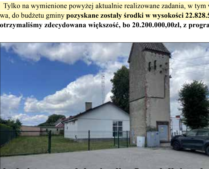
Ogrodzenie terenu oraz wybudowanie parkingu dla samochodów i rowerów przy świetlicy w Zimnie

Tylko na wymienione powyżej aktualnie realizowane zadania, w tym właśnie zakończoną budową ścieżki rowerowej z Nagradowic do Kleszczewa, do budżetu gminy pozyskane zostały środki w wysokości 22.828.578,43zł. Z Rządowego Programu Inwestycji Strategicznych Polski Ład otrzymaliśmy zdecydowaną większość, bo 20.200.000,00zł, z programów unijnych 2.628.578,43zł.