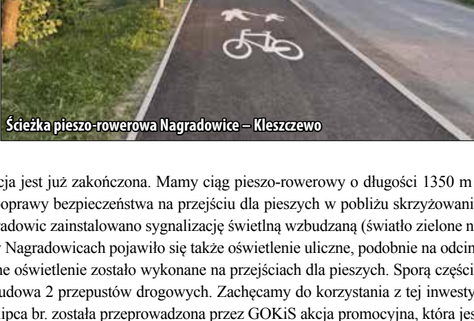
Ścieżka pieszo-rowerowa Nagradowice – Kleszczewo

Ta ważna, zwłaszcza z punktu widzenia mieszkańców Nagradowic inwestycja jest już zakończona. Mamy ciąg pieszo-rowerowy o długości 1350 m i szerokości 2,5 m, ponadto na długości 125 m chodnik o szerokości 2 m. Dla poprawy bezpieczeństwa na przejeździe dla pieszych w pobliżu skrzyżowania drogi wojewódzkiej nr 434 z drogą powiatową nr 2440P przy wjeździe do Nagradowic zainstalowano sygnalizację świetlną wzbudaną (światło zielone na przejeździe wywołane przez naciśnięcie przycisku). W rejonie skrzyżowania w Nagradowicach pojawiło się także oświetlenie uliczne, podobnie na odcinku od stacji benzynowej do włączenia w ul. Sportową w Kleszczewie. Specjalne oświetlenie zostało wykonane na przejściach dla pieszych. Spora część kosztów była przebudowa kolidującego z inwestycją gazociągu, jak również budowa 2 przepustów drogowych. Zachęcamy do korzystania z tej inwestycji rowerzystów. Celem przekonania do zmiany środka lokomocji na rower 23 lipca br. została przeprowadzona przez GOKiS akcja promocyjna, która jest częścią projektu.