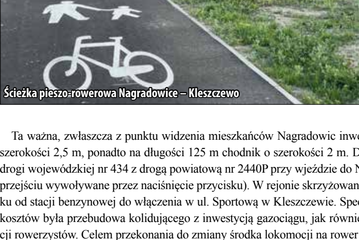
Ścieżka pieszo-rowerowa Nagradowice – Kleszczewo