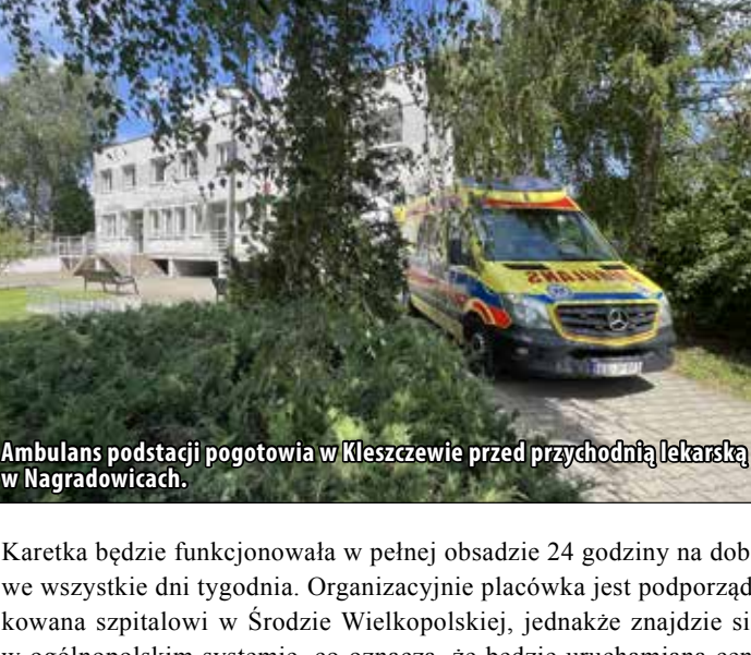
Ambulans podstacji pogotowia w Kleszczewie przed przychodnią lekarską w Nagradowicach.