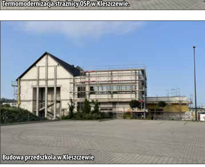
Budowa przedszkola w Kleszczewie

Posiunkowo niewielkim zadaniem, ale ważnym ze względu na bezpieczeństwo osób, w tym dzieci było ogrodzenie terenu oraz wybudowanie parkingu dla samochodów i rowerów przy świetlicy w Zimnie .