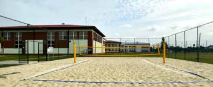
Nowe boisko do siatkówki plażowej w Tulcach

Na terenie rekreacyjno-sportowy przy ZS w Tulcach powstało boisko do piłki plażowej. Boisko do gry ma wymiary 8 na 16m, dodatkowo wokół zlokalizowano 5m strefę ochronną, zakończoną ogrodzeniem o wysokości 4m. Koszt całkowity 115.000 zł. Inwestycja zyskała wsparcie w ramach programu Samorządu Województwa Wielkopolskiego „Pięknieje wielkopolska wieś” 70.000 zł, Fundusz Sołecki 20.000 zł, dodatkowe środki z budżetu Gminy 25.000 zł. Koszt zleconej części budowlanej po przetargu wyniósł 96.063 zł. Obiekt jest ogólnodostępny, furka do ogrzewania na cel zabezpieczenie przed dostępem zwierząt.