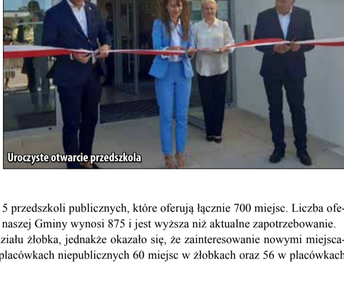
Uroczyste otwarcie przedszkola