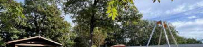
Plac zabaw w Poklatkach