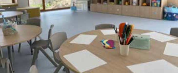
Wnętrze przedszkola „Bocianie Gniazdo”

W przedszkolu Bocianie Gniazdo planowane było również otwarcie oddziału złobka, jednakże okazało się, że zainteresowanie nowymi miejscami dla maluchów do 3 lat było znikome. Na terenie Gminy jest obecnie w placówkach niepublicznych 60 miejsc w złobkach oraz 56 w placówkach dziennej opieki.