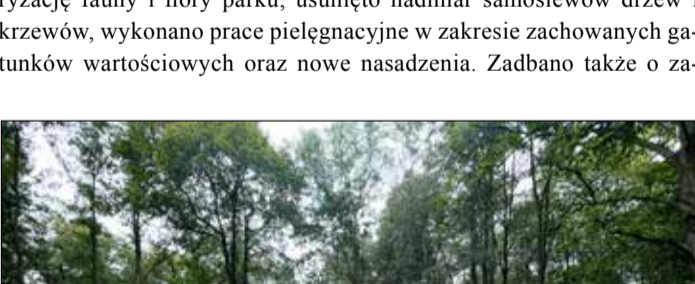
Park w Komornikach

Dobiegła końca rewitalizacja parku dworskiego w Komornikach. To już trzeci park, którego odtworzeniem zajęła się nasza Gmina. Park w Komornikach ma powierzchnię 4,7 ha. Przeprowadzono inwentaryzację fauny i flory parku, usunięto nadmiar samosiejów drzew i krzewów, wykonano prace pielęgnacyjne w zakresie zachowanych gatunków wartościowych oraz nowe nasadzenia. Zadbano także o za-