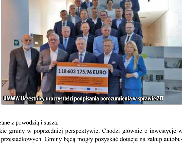
UMWV Uczestnicy uroczystości podpisania porozumienia w sprawie ZIT

Zdrowe i aktywne społeczeństwo Metropolii Poznańskiej – to kolejny ważny obszar, który będzie dotowany z funduszy europejskich. Powstanie, m.in. Zintegrowane Centrum Opieki i Teleopieki, zostaną poszerzone działania z zakresu usług społecznych wspierających rodziny i rodzinną pieczę zastępczą. Na pomoc mogą liczyć pracodawcy w zakresie poprawy ergonomii stanowisk pracy czy podnoszeniu kompetencji. Nie zabraknie również działań aktywizujących i integrujących środowiska lokalne.