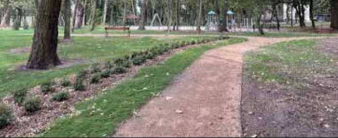
Plac zabaw w Poklatkach