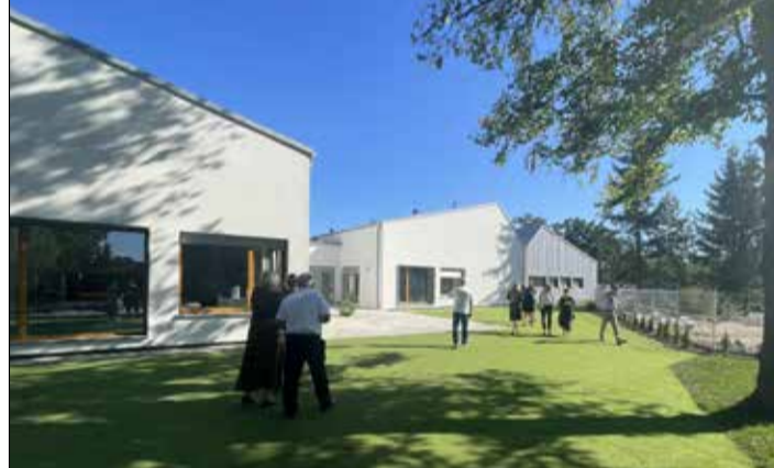
Przedszkole „Bocianie Gniazdo”